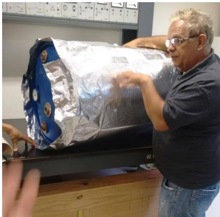
Figura 2 – Aquecedor sendo montado no Laboratório do Câmpus Jataí

Na Figura 2, pode-se observar um dos aquecedores que já foi desenvolvido e instalado no Albergue São Vicente de Paulo. Entretanto, o tempo do desenvolvimento do Projeto anterior e os recursos foram suficientes para a instalação de apenas dois aquecedores, sendo necessários mais quatro ASBC.