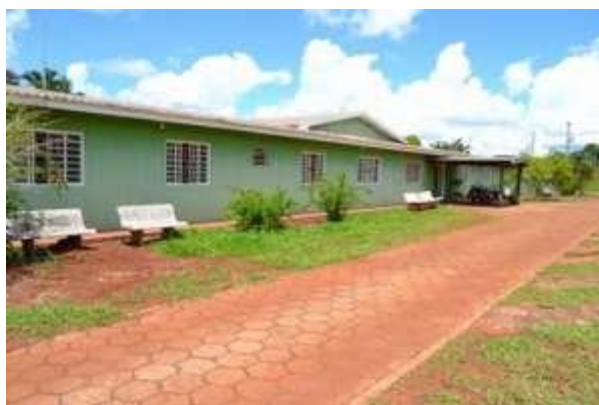
Figura 3 – Imagem do Albergue São Vicente de Paulo

Além disso, o projeto de desenvolvimento e instalação de ASBC irá colaborar para o processo de aprendizagem dos estudantes extensionistas envolvidos, que aprenderão na prática vários conteúdos de disciplinas do curso de Eletrotécnica. Será um momento de concretização da indissociabilidade entre ensino-pesquisa-extensão.