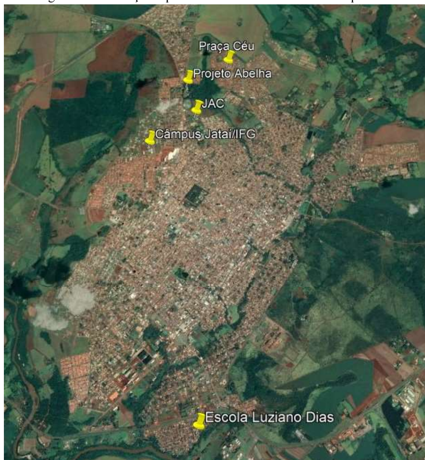
Figura 1: Distribuição espacial dos locais a serem atendidos pelo PID

Os locais a serem atendidos são aqueles que estão em bairros periféricos, de baixa renda, ou que atendem a esse público. A demanda para seu atendimento partir da própria comunidade e das Secretarias Municipais, que procuraram o IFG em busca de parcerias. Esses locais estão representados nas figuras a seguir: